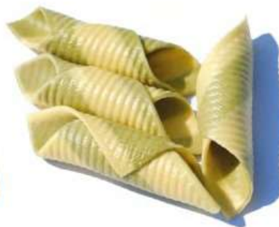
GARGANELLI PAGLIA E FIENO